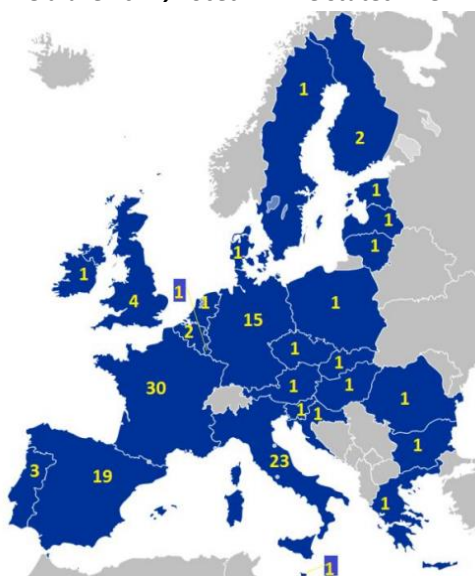
Obrázek č. 1; Počet PRV ve státech EU

Obr. č. 1 3 znázorňuje počet PRV v jednotlivých členských státech. Státy totiž mohly předložit jeden program nebo soubor regionálních programů (např. Itálie, Francie, Německo či Španělsko ). V případě, že země přistoupila na schválení regionálních programů, byla ponechána regionům jistá míra autonomie při nastavování pravidel dotační politiky a tím potažmo i celého multi-fondového financování. Situace se tak může významně lišit i uvnitř jednotlivých států.