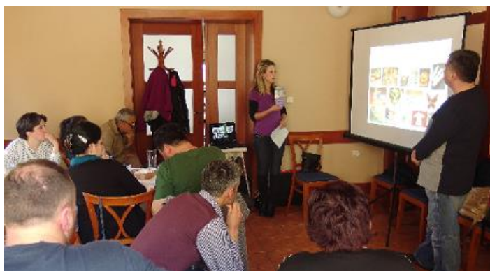
MAS Horní Pomoraví – prezentace regionální značení