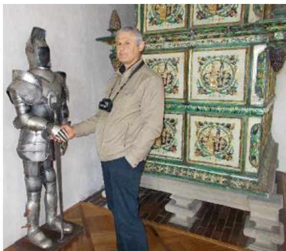
Na zámku v Doudlebech