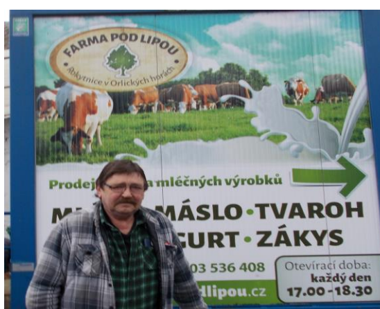
Farma pod lipou