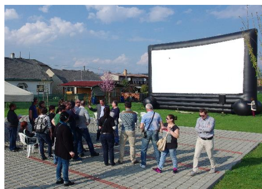
MAS Šumperský venkov – pojízdné kino